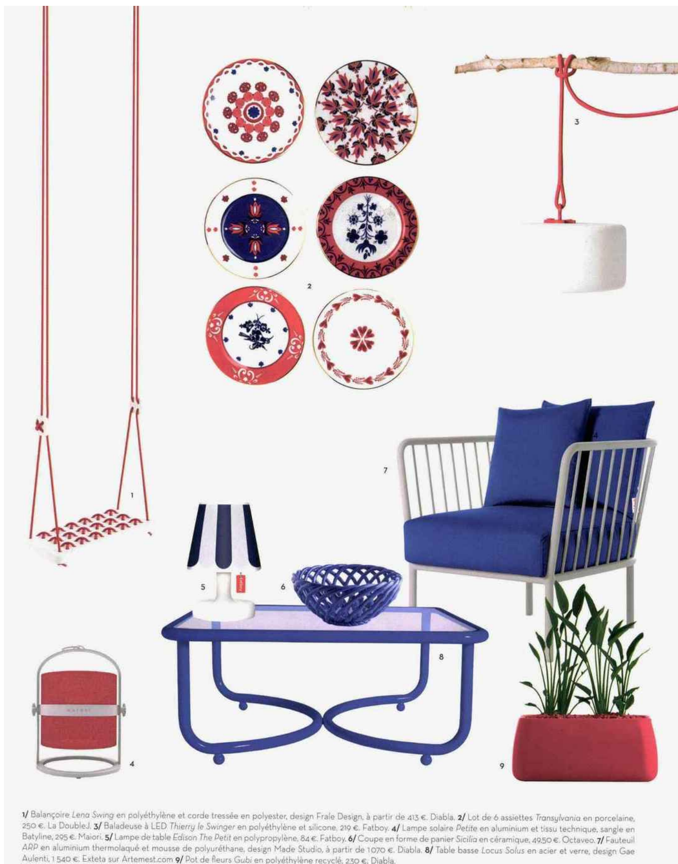
1/ Balançoire Lena Swing en polyéthylène et corde tressée en polyester, design Frale Design, à partir de 413 €. Diabla. 2/ Lot de 6 assiettes Transylvania en porcelaine, 250 €. La DoubleJ. 3/ Baladeuse à LED Thierry le Swinger en polyéthylène et silicone, 219 €. Fatboy. 4/ Lampe solaire Petite en aluminium et tissu technique, sangle en Betyline, 295 €. Maiori. 5/ Lampe de table Edison The Petit en polypropylène, 84 €. Fatboy. 6/ Coupe en forme de panier Sicilia en céramique, 49,50 €. Octaveo. 7/ Fauteuil ARP en aluminium thermolaqué et mousse de polyuréthane, design Made Studio, à partir de 1070 €. Diabla. 8/ Table basse Locus Solus en acier et verre, design Gae Aulenti, 1 540 €. Exteta sur Artemest.com 9/ Pot de fleurs Gubi en polyéthylène recyclé, 230 €, Diabla.