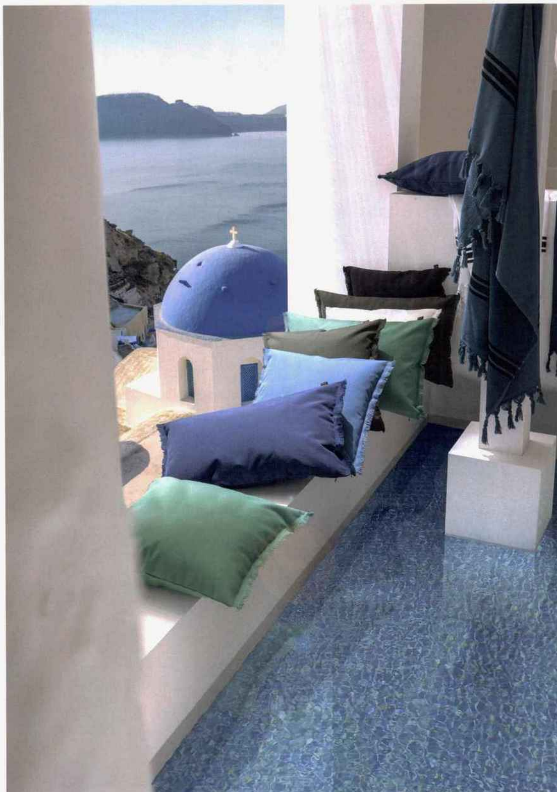
Housses de coussin outdoor Bimini en polyester anti-UV déperlant, à partir de 14,75 € l'unité. Harmony Textile ;